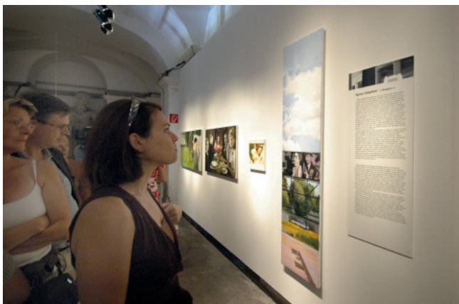
5.500 Besucher sahen „Central Europe Revisited I“

A Sala Terrena, amely 2006-ig az Esterházy Borászat otthonául szolgált, a kastélyegyüttes új koncepciójának aktuális terveiben is központi szerepet játszik. A Sala Terrena megnyitása fontos lépés az új kastélyegyüttes jövőjében, amely a régi fonalat követve, azt konzekvensen továbbfejleszteni akarja.